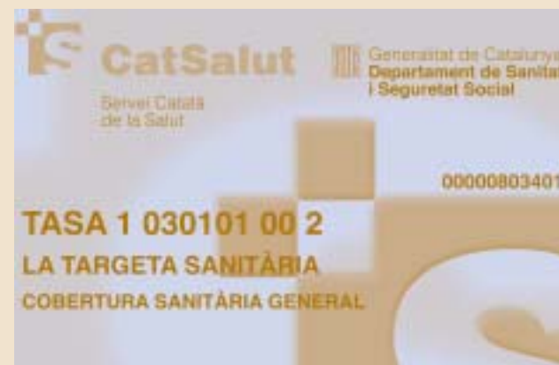
Targeta sanitària del CatSalut / Tarjeta sanitaria del CatSalut

Se recomienda poner la primera ropa del bebé dentro de la bolsa con una toalla de baño. Una buena idea es tener las mudas preparadas dentro de bolsitas. La ropa del bebé debe estar lavada con jabón neutro sin suavizante, planchada, y sin etiquetas.